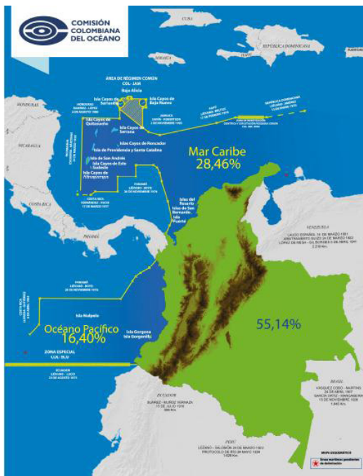
Figura 1. Extensión Marítima de Colombia.

Colombia cuenta con una extensión territorial de 2.070.408 km 2 de los cuales 928.660 km 2 (44,86%) corresponden a territorio marítimo. El mar Caribe representa un 28,46% de esa extensión y el océano Pacífico el 16,40% restante. Asimismo, la línea de costa se extiende por 3.189 km, de los cuales 1.600 son en el Caribe y 1.589 en el Pacífico. Los límites marítimos de Colombia en el mar Caribe son ocho: Panamá, Costa Rica, Nicaragua, Honduras, Jamaica, Haití, República Dominicana y Venezuela; en el Pacífico limita con tres países: Panamá, Costa Rica y Ecuador (ESDEGUE, 2016) .